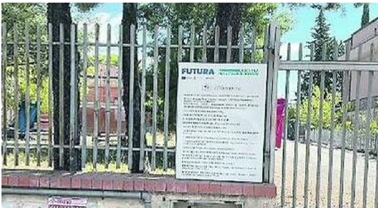
Asilo-cantiere a Cretarossa la riapertura slitta a febbraio BENEVENTO