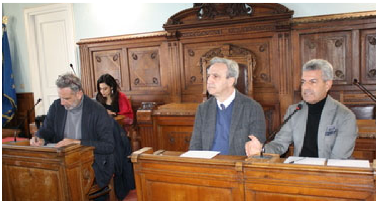
Dimensionamento scolastico, focus alla Rocca dei Rettori BASELICE