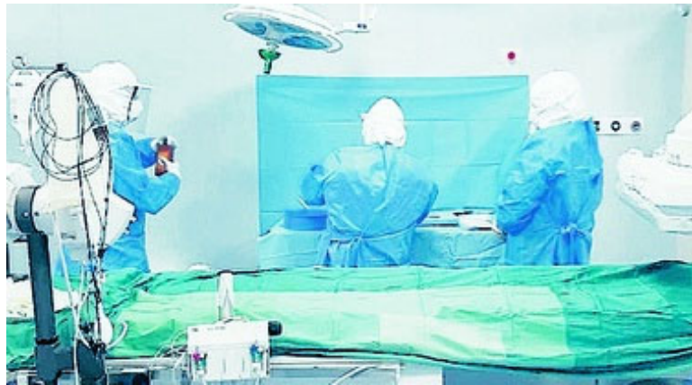
Benevento: morta dopo by pass gastrico al Fatebenefratelli, rinviati a giudizio due medici