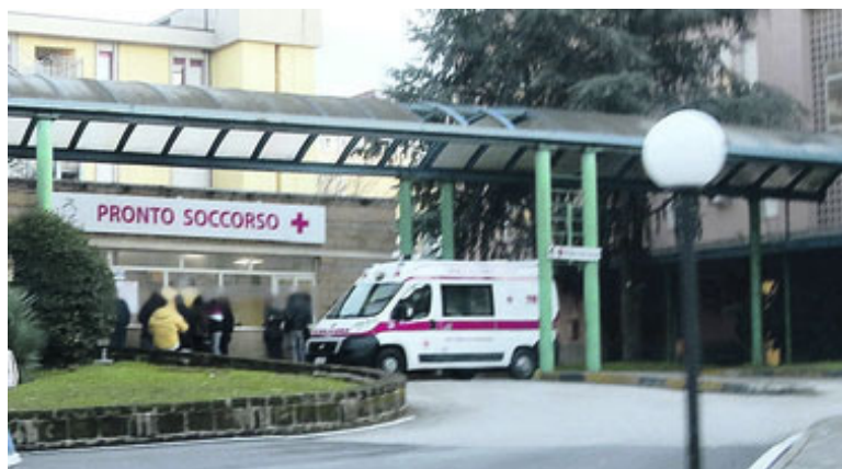
Medici: 80 bandi in un anno ma il San Pio resta vuoto

Problemi che a ieri sera non erano ancora stati risolti. Sono stati rilevati malfunzionamenti gravi in tutto il Paese e a tutti i livelli della pubblica amministrazione, dal ministero dell'Ambiente, l'Agenzia delle Entrate e la Banca d'Italia, ai tanti municipi dello Stivale. In Campania sono andate in tilt amministrazioni come Nola, Marcianise, Bacoli, Succivo, Casal di Principe . Nel Sannio, oltre a Foiano di Valfortore, in panne totale i servizi