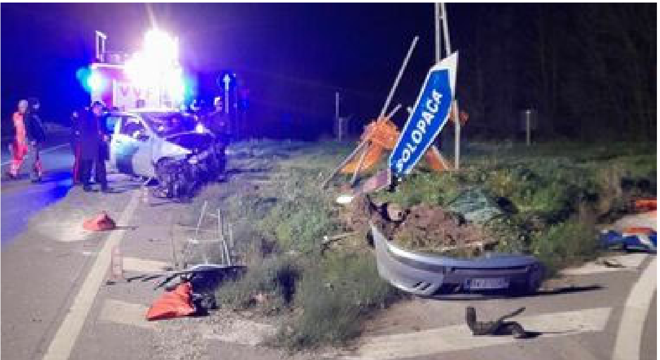
Incidente Fondovalle Isclero, autopsie in programma giovedì BENEVENTO