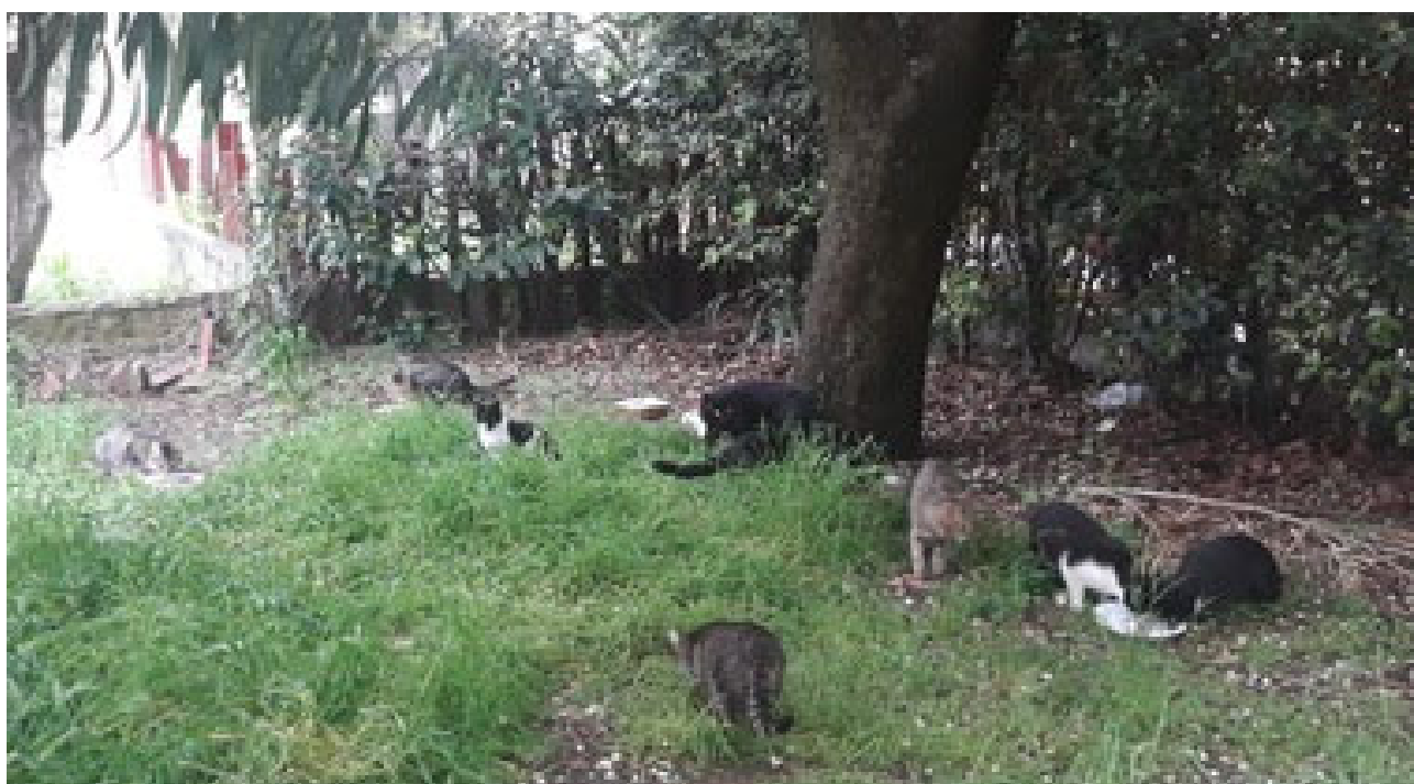
«Gatto decapitato, aiutateci a individuare i responsabili» BENEVENTO