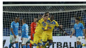
Napoli, che choc col Frosinone e il Maradona adesso contesta