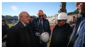
Demolita la prima tribuna