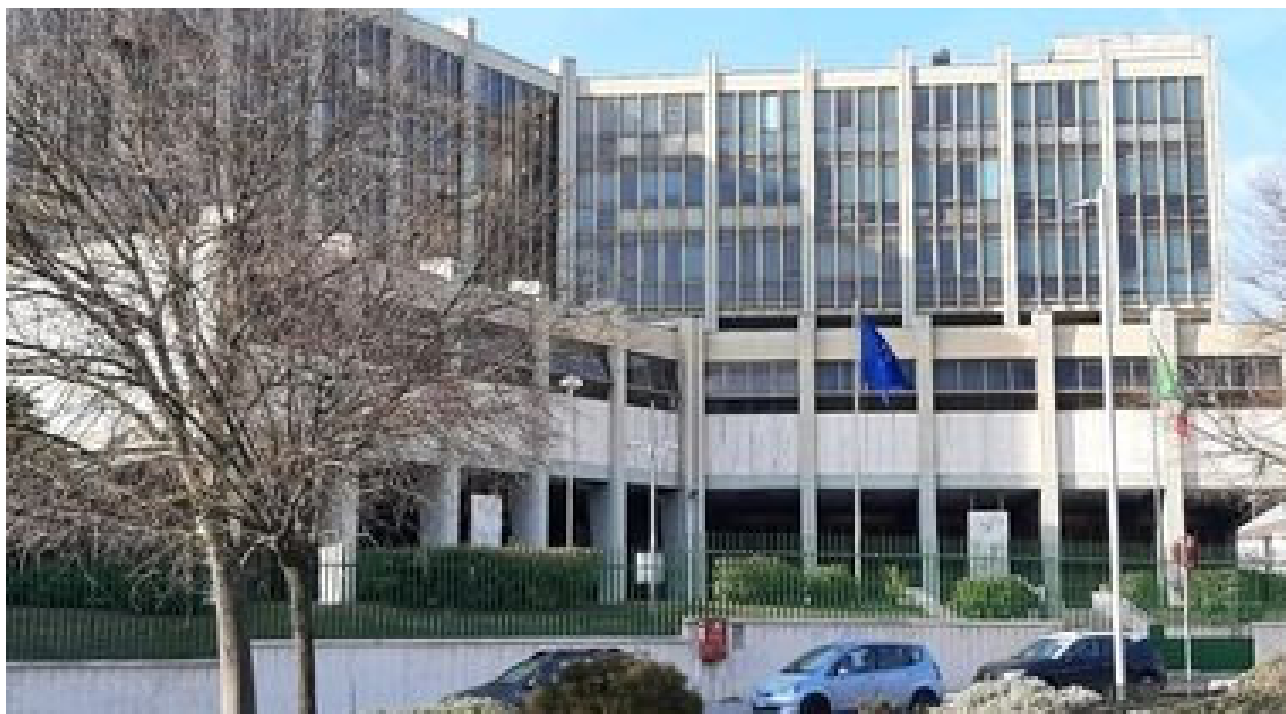
Controlli su sicurezza alimentare, in 14 a processo: tra loro medici Asl BENEVENTO