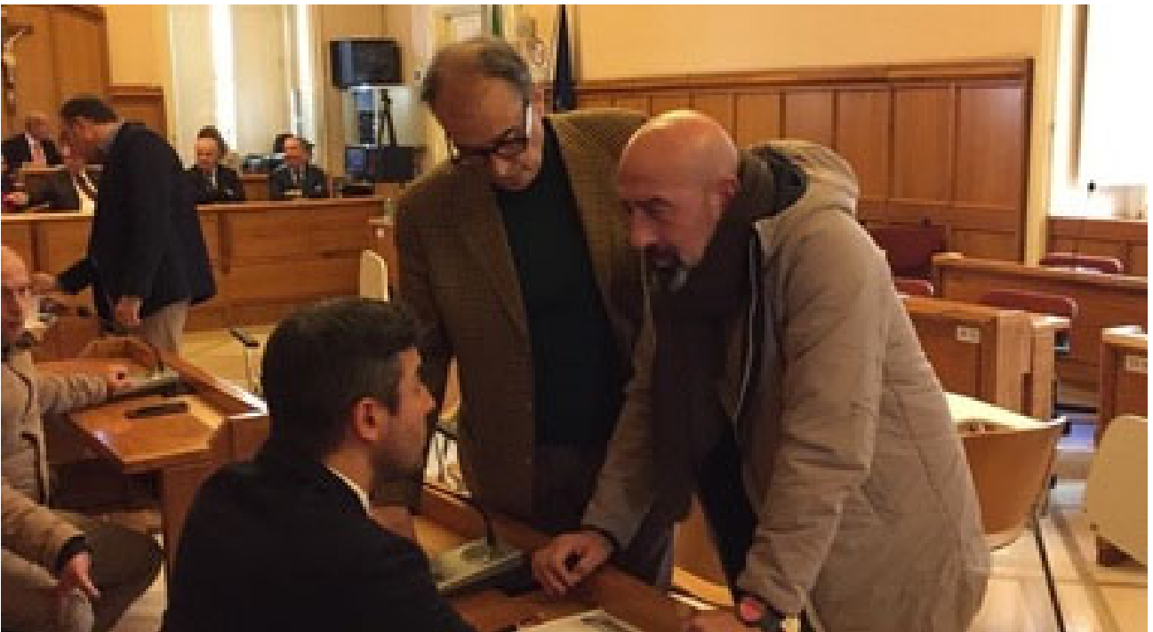
C'è il via libera in Consiglio a Dup e debiti fuori bilancio SAN LORENZELLO