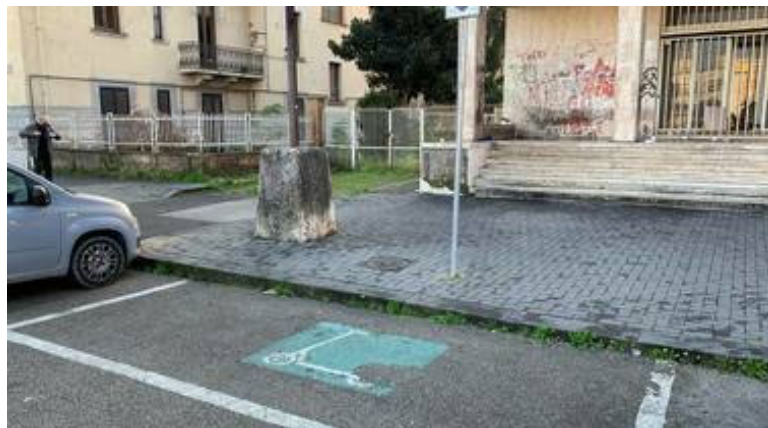
Piazza Risorgimento, ordine di allontanamento per un parcheggiatore abusivo