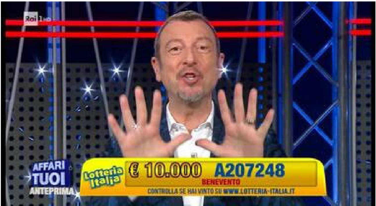
Lotteria Italia a Benevento, Amadeus svela la vincita