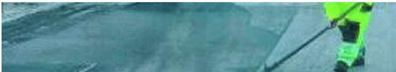
Lavori in centro lunghe code e disagi: «Nessun preavviso» BENEVENTO