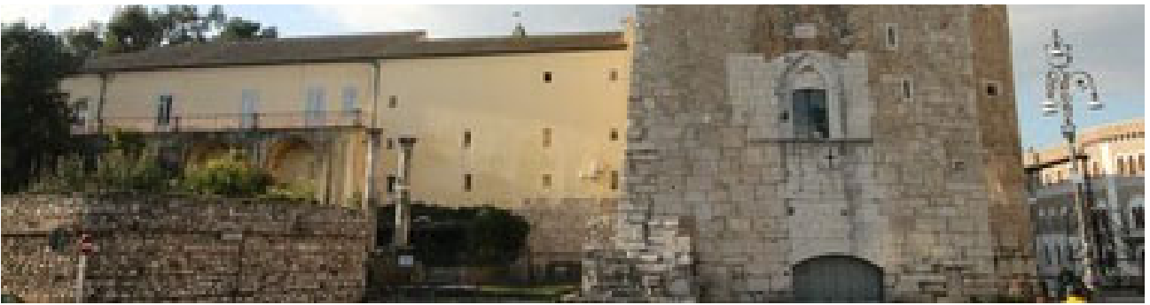
Provinciali, le liste scaldano i motori: arriva l'election day BENEVENTO