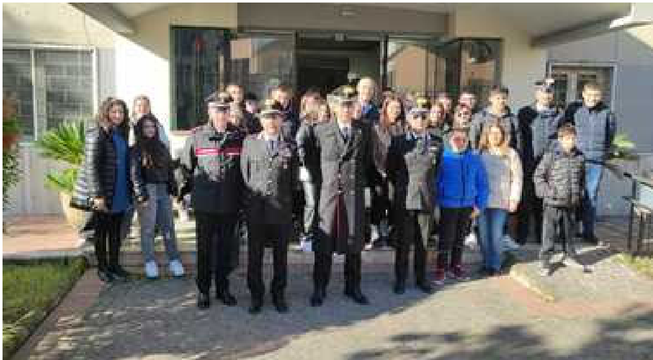
Cultura della legalità, l'Arma incontra le scuole cittadine BENEVENTO