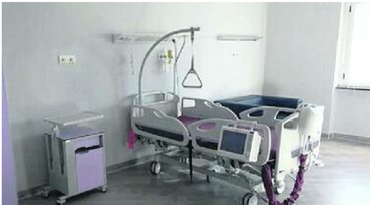
Gestire il fine vita con l'hospice dell'Asl, più dignità ai pazienti DURAZZANO