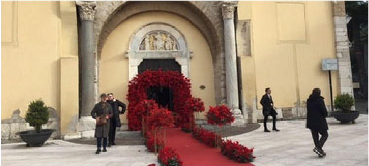
Santa Sofia, giro di vite stop agli addobbi «trash» BENEVENTO