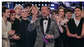
Amadeus beato tra i giovani: ecco chi sono i tre promossi big