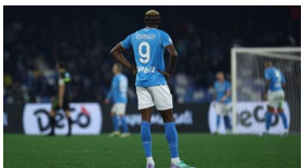
Napoli è stanca del Napoli: azzurri contestati dopo il ko